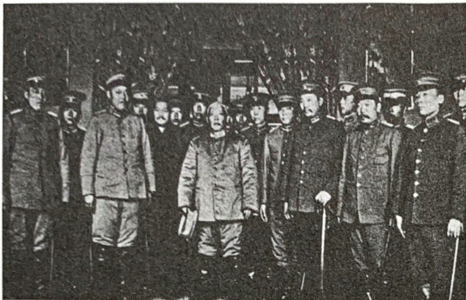
袁世凯就任中华民国临时大总统后与北洋将领合影

袁世凯以北方秩序不易维持等为借口，不肯南下，迫使南京参议院同意他在北京就职。3月，袁世凯在北京就任中华民国临时大总统。4月，孙中山正式解除临时大总统职务。临时政府迁往北京。辛亥革命的胜利果实被袁世凯窃取。