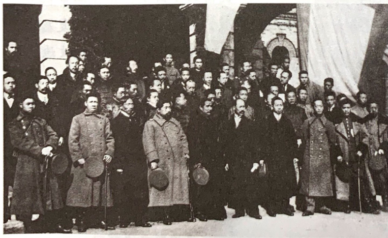
孙中山与临时参议院议员合影

武昌起义胜利后，各省纷纷独立，革命形势的发展要求有一个统一的中央政府。经过多方协商，决定在南京成立临时中央政府。1911年12月，各省代表在南京集会，选举孙中山为临时大总统。